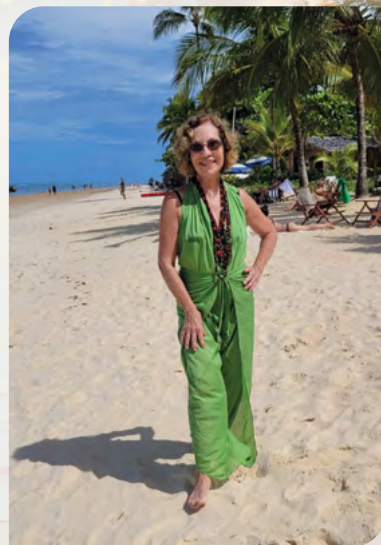
Praia dos Coqueiros.

referem-se a almoços e refeições ligeiras, à exceção do melhor balcão, no El Gordo, no Quadrado. Outro que não dá para ficar sem fazer uma reserva é o Capim Santo. Muito bom para durante o dia é o Restaurante Benito e se tiver vontade de comer quibe vá lá no DOM, ambos na entrada do Quadrado. Trancoso é uma área de preservação ambiental que abraça a história, a cultura e a arte brasileira com bom-gosto e consciência ecológica e sustentável. É um pedaço desse Brasil onde se pode desfrutar de uma natureza rica e rara e conviver com o povo alegre e afetuoso do lugar sem medo de ser feliz. Para mim é um luxo poder curtir as caminhadas até a praia, os cafés, as pessoas, o mar e viver sem pressa toda a simplicidade charmosa de Trancoso. ●