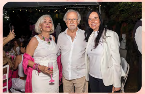
ME e Marcelo e a Deputada Estadual Ione Pinheiro