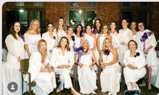
Todas as autoras

las como instrumento de conexão, inspiração e transformação de vida de outras mulheres.