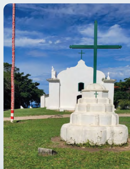
A Paróquia de São João Batista no Quadrado.

referem-se a almoços e refeições ligeiras, à exceção do melhor balcão, no El Gordo, no Quadrado. Outro que não dá para ficar sem fazer uma reserva é o Capim Santo. Muito bom para durante o dia é o Restaurante Benito e se tiver vontade de comer quibe vá lá no DOM, ambos na entrada do Quadrado. Trancoso é uma área de preservação ambiental que abraça a história, a cultura e a arte brasileira com bom-gosto e consciência ecológica e sustentável. É um pedaço desse Brasil onde se pode desfrutar de uma natureza rica e rara e conviver com o povo alegre e afetuoso do lugar sem medo de ser feliz. Para mim é um luxo poder curtir as caminhadas até a praia, os cafés, as pessoas, o mar e viver sem pressa toda a simplicidade charmosa de Trancoso. ●