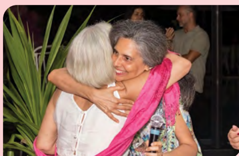
Abraço da cantora lírica Tânia Prates