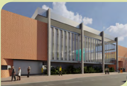
Fachada da nova unidade

O projeto arquitetônico, assinado por Guilherme Moretzsohn, foi pensado para atender a diversas linguagens artísticas. Com uma boca de cena de 9 metros e 10 metros de profundidade, o palco terá dimensões ideais para espetáculos de dança e grandes montagens teatrais.