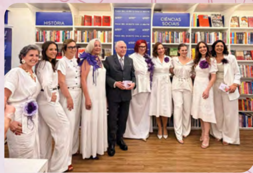
As coautoras em São Paulo com o ex-presidente Michel Temer

sucesso” teve dois lançamentos oficiais que reuniram centenas de leitoras, convidadas e coautoras para celebrar essa obra inspiradora. O primeiro evento aconteceu em São Paulo , no dia 18 de março na Livraria da Vila , localizada na Alameda Lorena , no bairro Jardim Paulista , na capital paulista . Já em Belo Horizonte , o lançamento foi realizado no dia 26 de março na Parrilla Savassi , situada na Rua Professor Moraes .