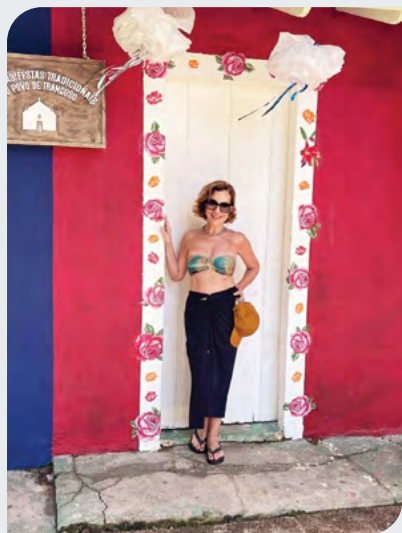
Nas casinhas do Quadrado.

Com seu estilo próprio, ao mesmo tempo rústico e sofisticado, a cidade de Trancoso, no sul da Bahia distrito do município de Porto Seguro, tornou-se uma praia cheia de charme e passou a integrar a agenda de turismo de luxo a partir do final dos anos 90. Até lá, o lugar não passava de uma aldeia de pescadores, originalmente chamada São João Batista dos Índios e hoje conta com aproximadamente 20.000 habitantes. Não faz muitos anos que conheci Trancoso mas foi paixão à primeira vista e tenho ido para lá duas vezes ao ano. No mês de março voltei a visitar o distrito e vivi lindos dias de muito sol, mar azul e alto astral. A tempera-