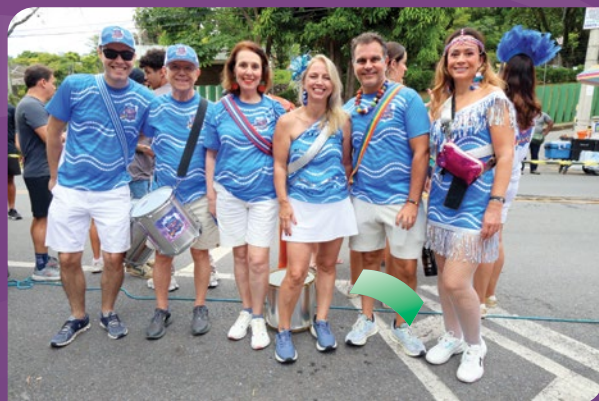
Componentes da bateria do clube