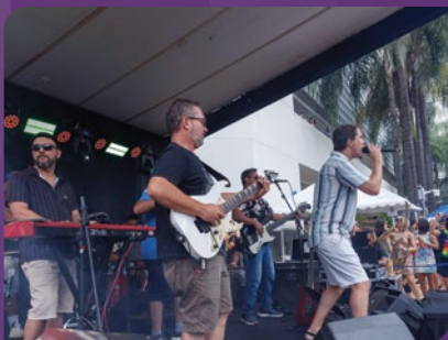
Show da banda Meu Rei agitou a segunda-feira de Carnaval