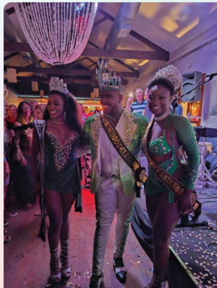
Corte Momesca 2026 - Belotur