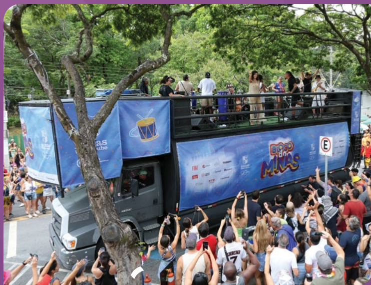
Trio elétrico do MTC

O Carnaval do Minas Tênis Clube mais uma vez foi um grande sucesso entre os associados, consolidando-se como uma das opções mais completas e confortáveis para quem deseja curtir a folia sem abrir mão da estrutura e da segurança do Clube. De sábado a terça-feira de Carnaval, o público aproveitou o Minas Folia, evento que reuniu shows ao vivo com repertórios repletos de brasilidade e animação. No dia 14, a programação ocorreu no Minas Country e, nos demais dias, na Área das Piscinas do Minas I, transformando os espaços em verdadeiros pontos de encontro para celebrar a festa mais popular do país. As crianças e suas famílias também tiveram um espaço especial com as tradicionais Matinês de Carnaval, que contaram com decoração temática, DJ e banda infantil. Um ambiente lúdico e seguro, perfeito para os pequenos exibirem fantasias criativas e aproveitarem momentos de muita diversão. Com atrações para todos os públicos, o Carnaval do Minas reforçou seu compromisso em oferecer experiências completas de lazer, convivência e entretenimento aos seus associados. ●