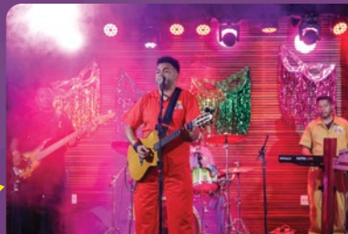
Banda Chukaka agitou os três dias de folia no Minas I