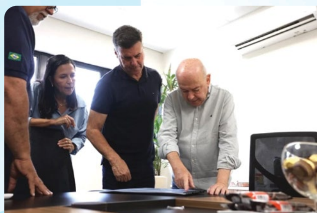
Prefeito de OP, Ângelo Oswaldo