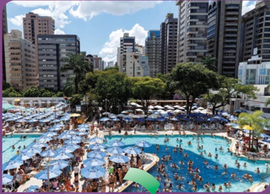
Sambão na piscina do Minas I