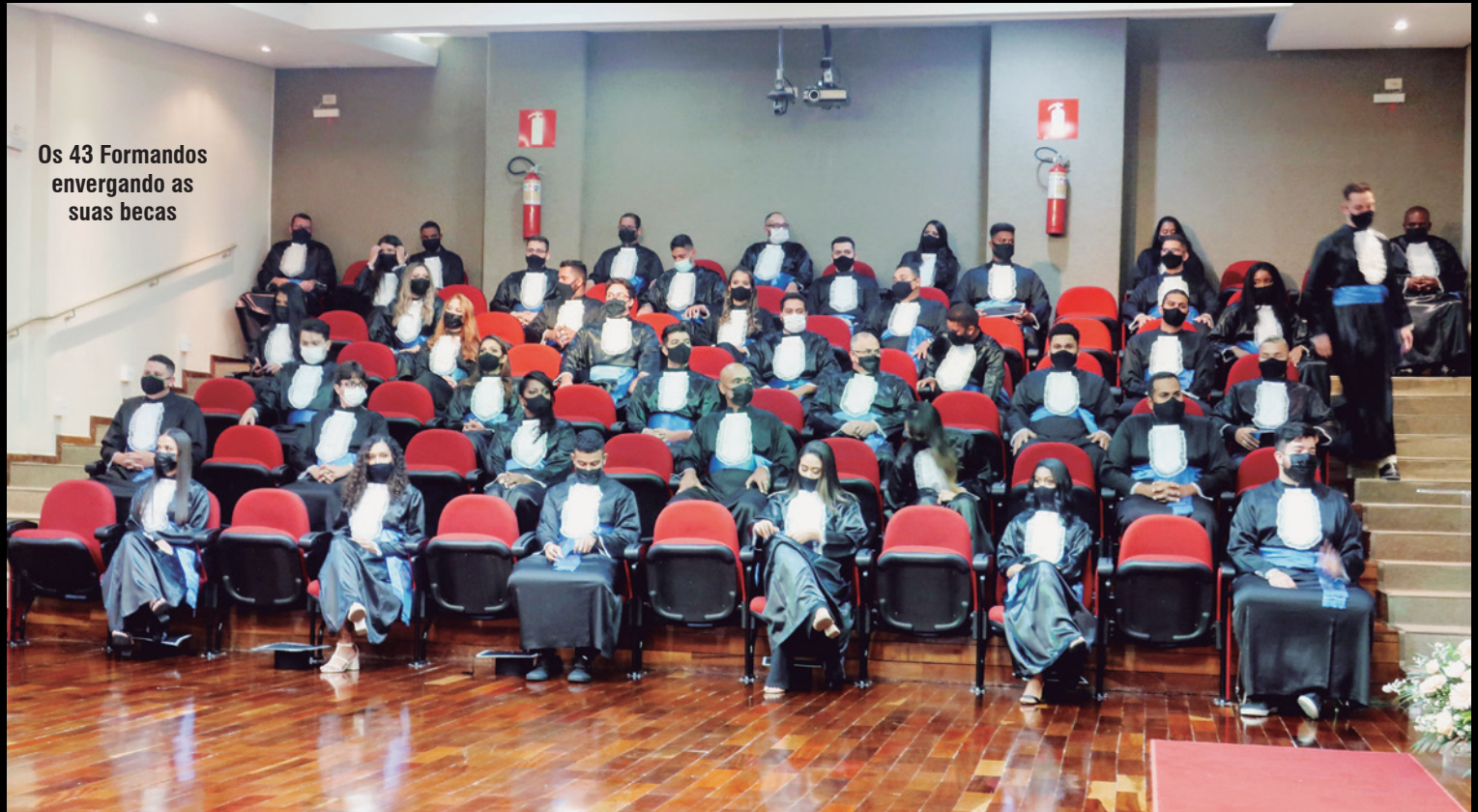
Os 43 Formandos envergando as suas becas