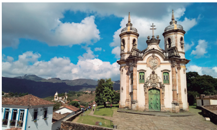
Igreja da Ordem Terceira de São Francisco da Penitência, localizada em Ouro Preto (MG)

Monumentos estão localizados no Brasil, na Índia, em Cabo Verde, em Macau e no Marrocos