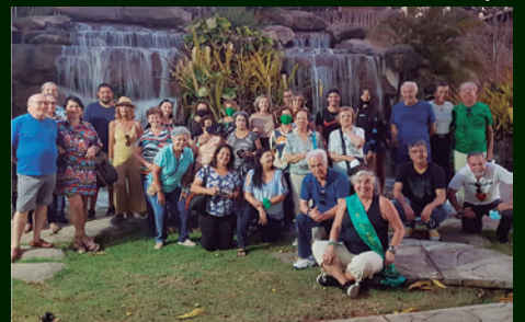
Um dos grupos de turistas de BH

O GRANDE HOTEL TAUÁ DE ARAXÁ, antes fechado, devido a pandemia, abriu seus suntuosos espaços para a FESTA DA PRIMAVERA. Recuperado e extremamente preparado, tendo a frente mais de 70 novos e competentes funcionários. Várias atividades, shows, noites regadas a queijos e vinhos, terminando com o Baile de Encerramento onde foi eleita a MISS MELHOR IDADE DE 2021, agraciada com uma estada com acompanhante. As doze concor-