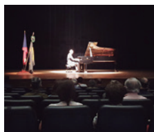
Pianista Václav Pacl no seu recital

O recital de piano do artista checo Václav Pacl atraiu uma seleta plateia. A música clássica checa do século XIX foi muito bem recebida e o público acompanhou o pianista com uma grande ovação de pé ao