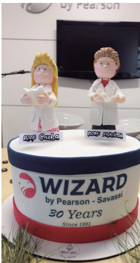
Bolo dos 30 anos