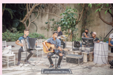
A banda que agitou a festa