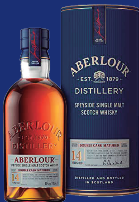
Scotch Whisky Aberlour 14 Anos Single Malt, 700ml

Segundo os apreciadores esse whisky é melhor que o Gold Label. Com um custo dos mais simpáticos ele já é sucesso de venda e está disponível exclusivamente no Brasil na loja da Amazon. ●